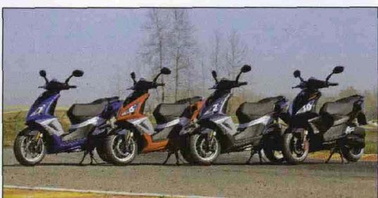
Qui sopra, la gamma colori del nuovo Speedfight

molto ben bilanciato, questo nuovo Speedfight è molto più vicino al concetto di guida " motociclistica", non presenta reazioni nervose e scende in piega con grande sicurezza e appoggio. La forcella è solida e scorrevole, tant'è che rimane efficace anche nelle staccate più violente. Anche il mono ammortizzatore posteriore lavora bene, tiene a bada il posteriore e scongiura fenomeni di oscillazione in percorrenza di curva. Meno reattivo e scorbuto, ad esempio dello Zip, è più facile ed intuitivo da portare al limite, va guidato maggiormente con il corpo ed è proprio questa la sua arma vincente. La frenata è bilanciata ed il disco anteriore "oversize" mi permette di staccare con forza